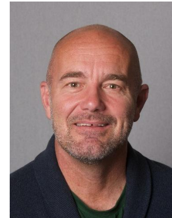
Cyngorydd Craig ab Iago Aelod Cabinet Amgylchedd

Mae'r cynnydd hwn yn rhoi sylfaen gadarn inni barhau â'r daith, ond mae hefyd yn ein hatgoffa nad yw'r gwaith wedi ei gwblhau. Ein her bellach yw adeiladu ar y llwyddiant hwnnw drwy wneud penderfyniadau dewr a blaengar, fydd yn sicrhau nid yn unig ein bod yn lleihau ein heffaith, ond ein bod yn diogelu ac yn gwella'r amgylchedd ar gyfer cenedlaethau'r dyfodol.